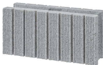
■ ショット 7L12 (ローズ) (12cm 専用色) 両面