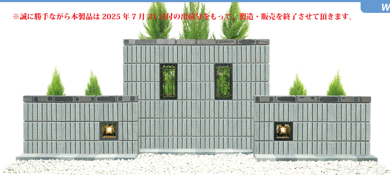
■ ショット 7L12・7L15 (トパーズ) 両面

※誠に勝手ながら本製品は2025年7月31日付の出荷分をもって、製造・販売を終了させていただきます。