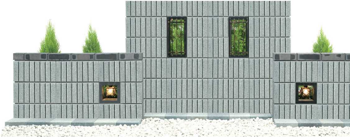
■ ショット 7L12・7L15 (トパーズ) 両面