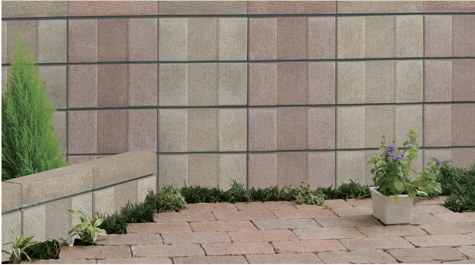
■ キューブ ロック [ブラウン] 両面

※誠に勝手ながら本製品は2025年7月31日付の出荷分をもって、製造・販売を終了させていただきます。