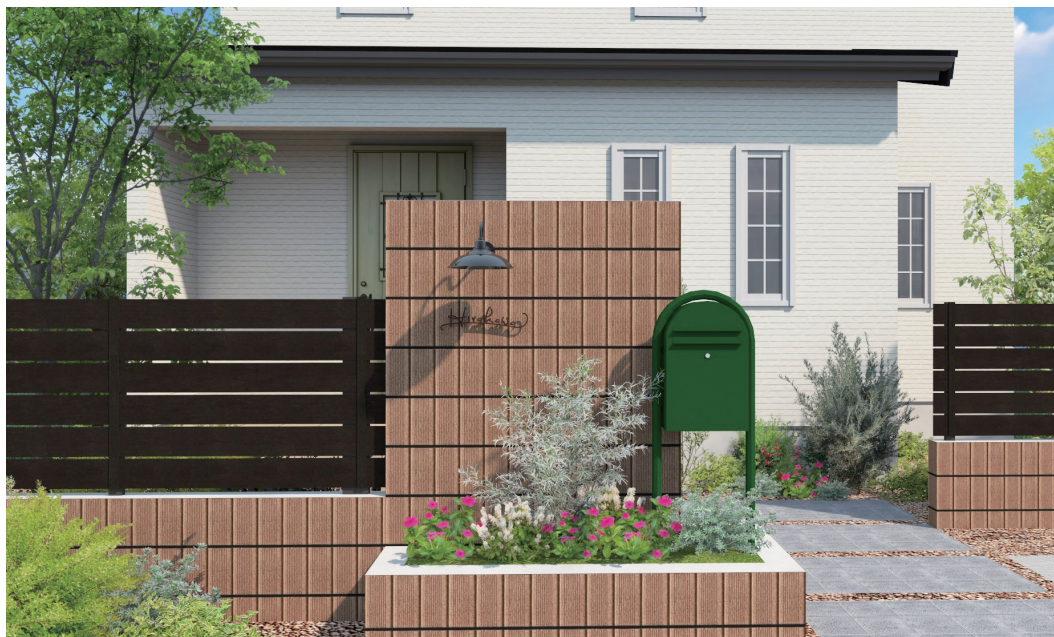
※上記画像はイメージパースです、実物サンプルをご確認いただくことをお勧めいたします。